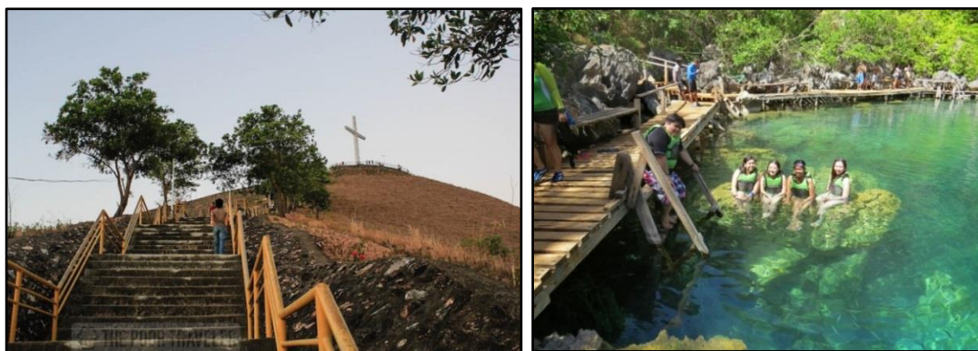
Figura 3. Kaliwa: Hagdan paakyat sa Mount Tapyas sa Coron (litratista: Yoshke Dimen; pinagkunan: The Poor Traveler website); Kanan: Tulay na kahoy sa gilid ng Kayangan Lake (litratista: Sarah Garcia; pinagkunan: Travel Journal /Saggi-Space Blogspot website)

Pangalawa, binabago o nilalagyan ng mga istruktura ang ilang pook-pasyalan para ito'y marating ng mga turista at maibagay o makatugon sa mga pangangailangan nila. Halimbawa na rito ang konstruksyon ng sementadong hagdan paakyat sa Mount Tapyas (Figura 3, kaliwa) at Kayangan Lake, pati na ang kahoy na tulay o daan sa tabi ng naturang lawa (Figura 3, kanan).