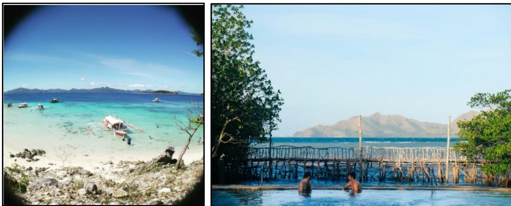
Figura 2. Kaliwa: Isang dalampasigan sa isla ng Coron; Kanan: Maquinit Hot Spring sa bayan ng Coron sa isla ng Busuanga

Ang pangalawang mito ay may kinalaman sa hangganan ng resorses – sa tila kawalan ng katapusan at kaubusan ng likas na yaman. Halimbawa, hindi nakikita sa mga litrato ang dulo ng mga likas na pook-pasyalan sa Calamianes, na wari ba’y walang hangganan ang mga ito. Palasak ang ganitong mito sa long at wide-angle shots na katulad ng nasa Figura 2. Inilarawan pa ng blogger ang litrato sa kaliwa na “ endless white sand beach ,” at ang sa kanan na, “ infinity pool flowing to Calamianes waters .” Animo’y maaaring magpakasaya sa pamamasyal hanggang sa mapagod ang katawan.