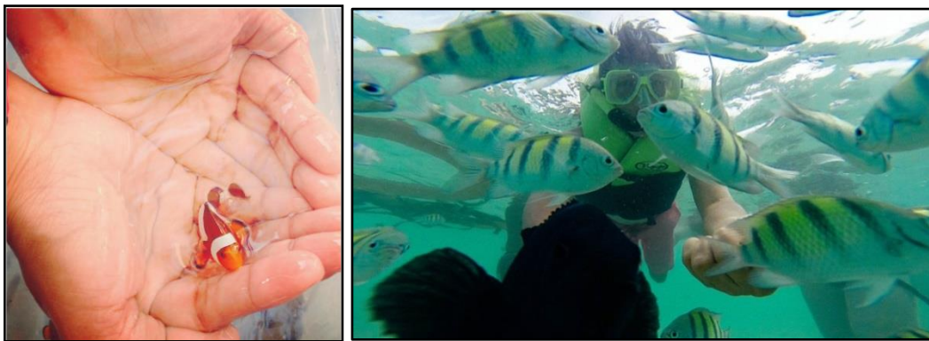
Figura 4. Kaliwa: Maliliit na isdang pansamantalang hinuli sa kamay ng isang turista; Kanan: Taong nagpapakain ng mga isda sa Banana Island sa Coron

na pangngialam o panghihimasok sa mga likas na tirahan ng mga hayop ay maaaring makasama sa mga ito. Sa pag- scuba diving sa mga protektadong eryang pangmarino, halimbawa, “ the evidence is that critical social and biological thresholds exist ” (Davis & Tisdell, 1995, p. 19). Ikinatwiran naman nina Buckley at Coghlan (2012) na ang paghuli ng mga isda at pagpapakawala sa mga ito pagkatapos ay maaaring makamatay sa ilang isda, kaya ang ganitong gawain ng turista ay matatawag na “ consumptive ” (p. 304). Isa ring kaugnay na isyu rito ay kung may tamang oryentasyon ang mga manlalakbay kung paano makikisalamuha sa mga hayop sa likas na pook-pasyalan.