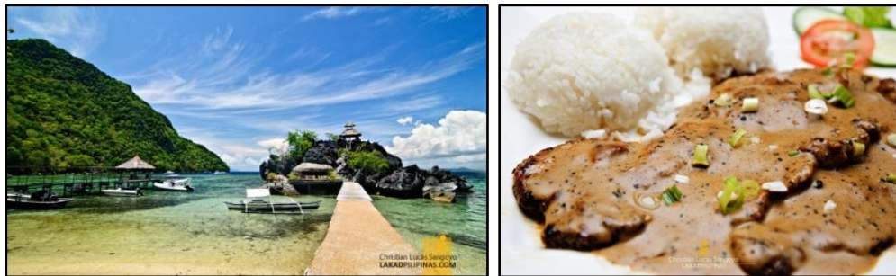
Figura 6. Kaliwa: Isang mabato na bahagi ng Sangat Island Dive Resort sa Coron ; Kanan: Beef terdenloin na may pepper sauce, isa sa mga pagkaing iniaalok ng Bistro Coron sa mga turista