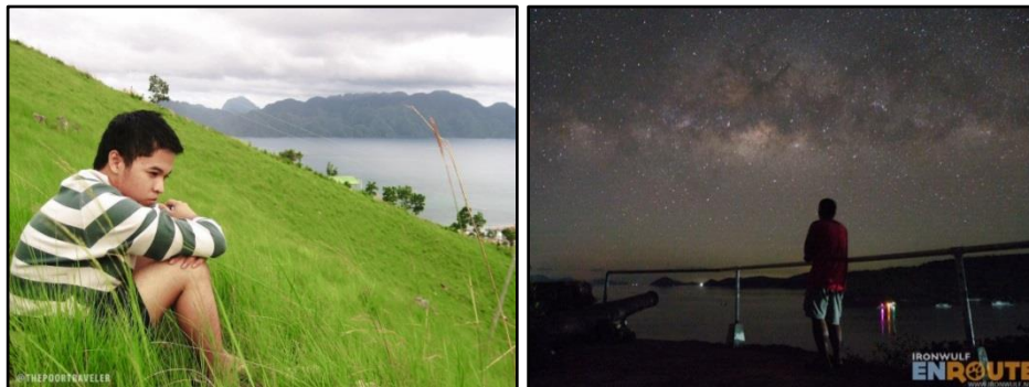
Figura 7. Kaliwa: Blogger ng The Poor Traveler website na nagmumuni-muni sa Mount Tapyas sa Coron; Kanan: Blogger na nakatitig sa kalangitan at karagatan sa gabing maraming bituin

Sa kabilang dako, therapeutic din kaya sa mga hayop sa ilang at sa dagat ang madalas na pambubulabog sa kanila ng mga turista, lalo na sa kanilang kaligirang tinatahanan, pinangingitlugan, at kinalalakhan?