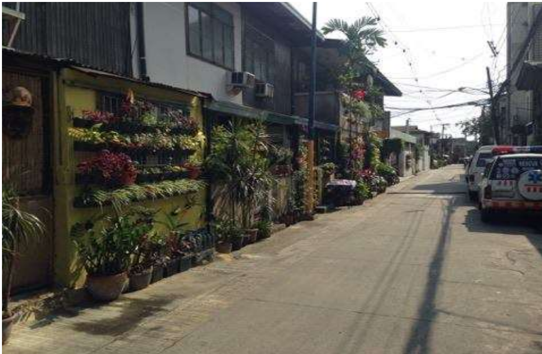
Larawan 1: Ang vertical garden sa Daang A. Mendoza, Barangay Kasilawan