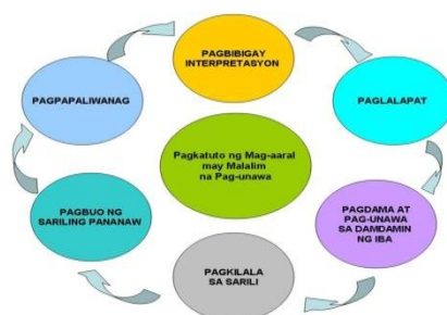
Pigyr 1. Balangkas Konseptwal

Higit na mauunawaan ang konsepto ng pag-aaral sa pamamagitan ng balangkas konseptwal.